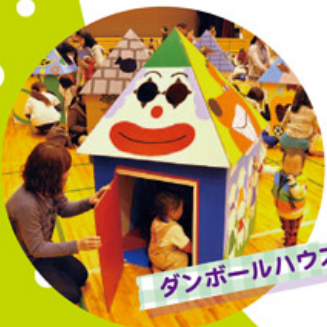
ダンボールハウス

開場 9:30 開演 10:00~11:30 ※当日 7:00 時点で「大雨」「洪水」「暴風」等の警報発令時は中止