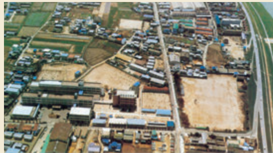
大学開学当時の風景