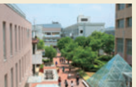
就実大学・短期大学