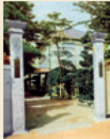
短期大学開校当時の正門