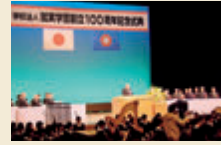
就実学園 創立100周年記念式典 (岡山シンフォニーホール)