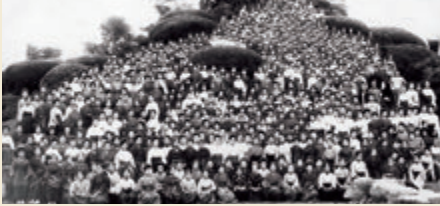
開校3年目、後楽園の唯心山に集った全校生徒500余名(7月)