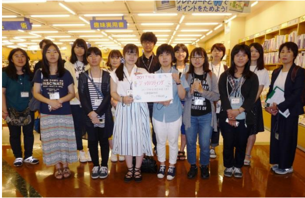
学生 14 名、職員 1 名が参加しました。 紀伊国屋クレド岡山店にご協力いただきました。